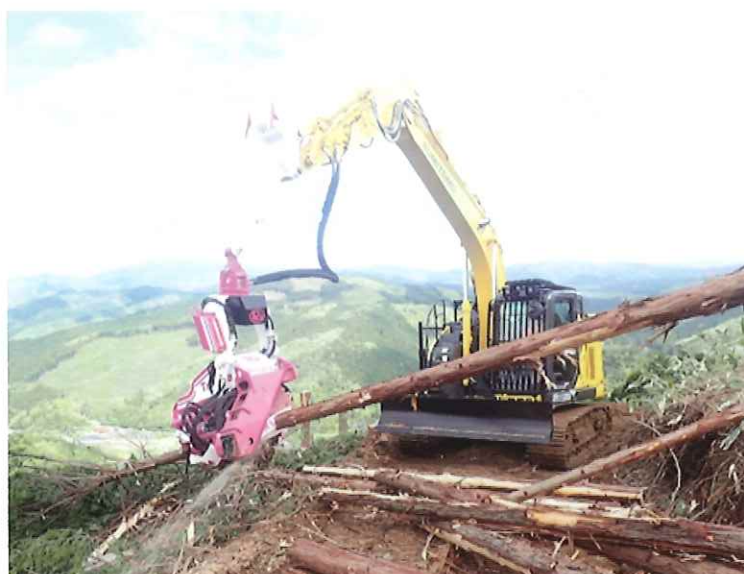
ハーベスタ トリケラ (令和6年4月導入)