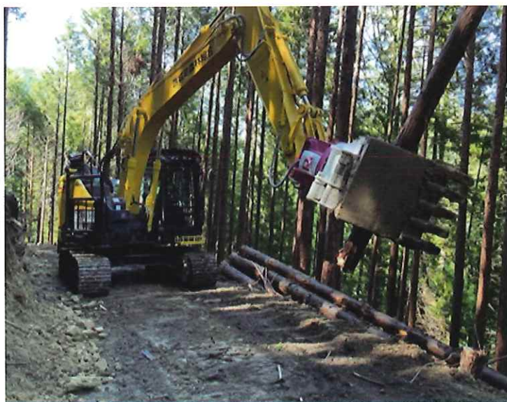
フェラバンチャザウルス (令和6年4月導入)