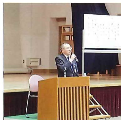
津田代表理事組合長