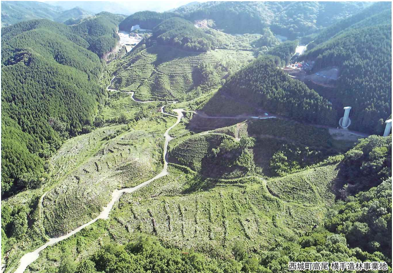
西城町高尾横手造林事業地

組合員の皆様には、平素より森林組合事業活動に格別なるご理解ご協力を賜り、誠に有難うございます。